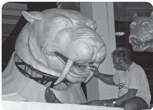
Alegorias que farão parte do espetáculo cênico "Ópera Popular do Vinho"

De 30 de janeiro a 24 de fevereiro, visitantes de todo o Brasil estarão na região ávidos por novidades. Com uma programação diversificada, a diretoria aposta em projetos e atrações voltados para promover o vinho e a cultura de todas as regiões vitivinícolas brasileiras, especialmente a Serra Gaúcha. Informações www.fenavinhobrasil.com.br .