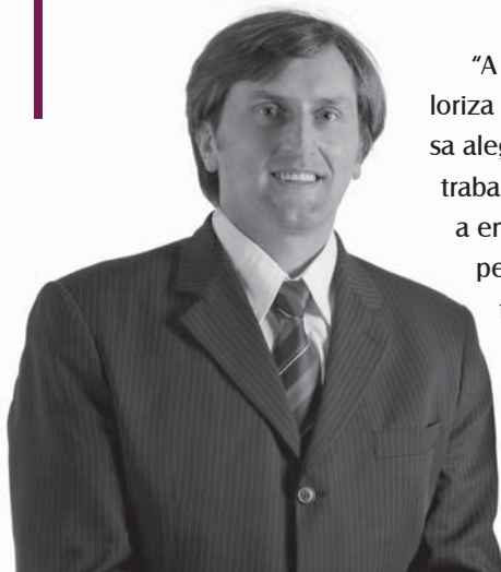
Roberto Lunelli Prefeito de Bento Gonçalves

“A Fenavinho retrata a história de nossa cidade, valoriza nossos antepassados, através da cultura, da nossa alegria, dos nossos costumes. O vinho representa o trabalho de nossos agricultores e agricultoras, o suor e a energia dos imigrantes, a força e a coragem de superar obstáculos, a criatividade de sobrepor desafios dos empreendedores que produzem um de nossos maiores produtos: o vinho. A Fenavinho é um resumo de tudo isso. Valoriza o que temos de melhor, resgata a história, eleva o nome de nossa cidade a todo país e a nível internacional, envolve a comunidade, é uma festa completa e merece todo o nosso incentivo e apoio. Na condição de prefeito desta cidade convido você a fazer parte desta grandiosa festa em sua 14ª edição”.